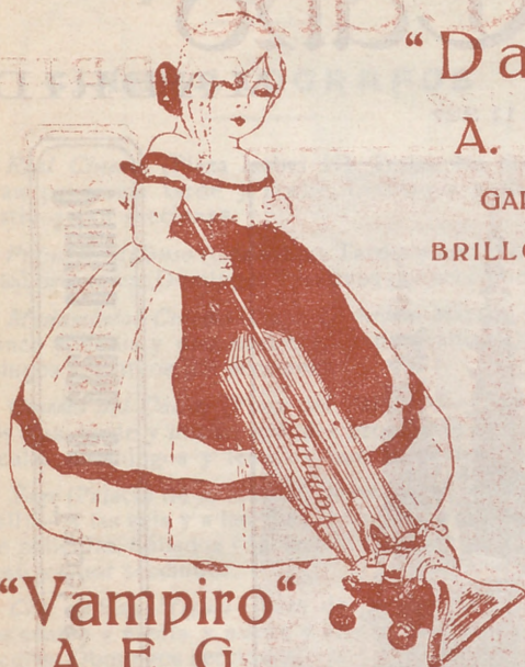
“Vampiro” A. E. G.