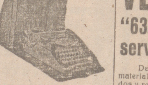
Máquinas de escribir portátiles y otras marcas