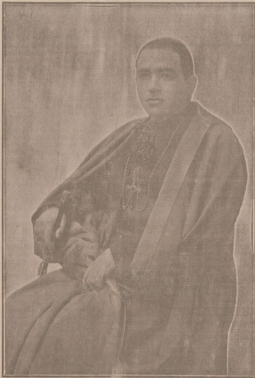
Emmo. y Rvdmo. Sr. Cardenal Segura

La situación de conjunto continúa sin modificación, conservando el aspecto favorable.