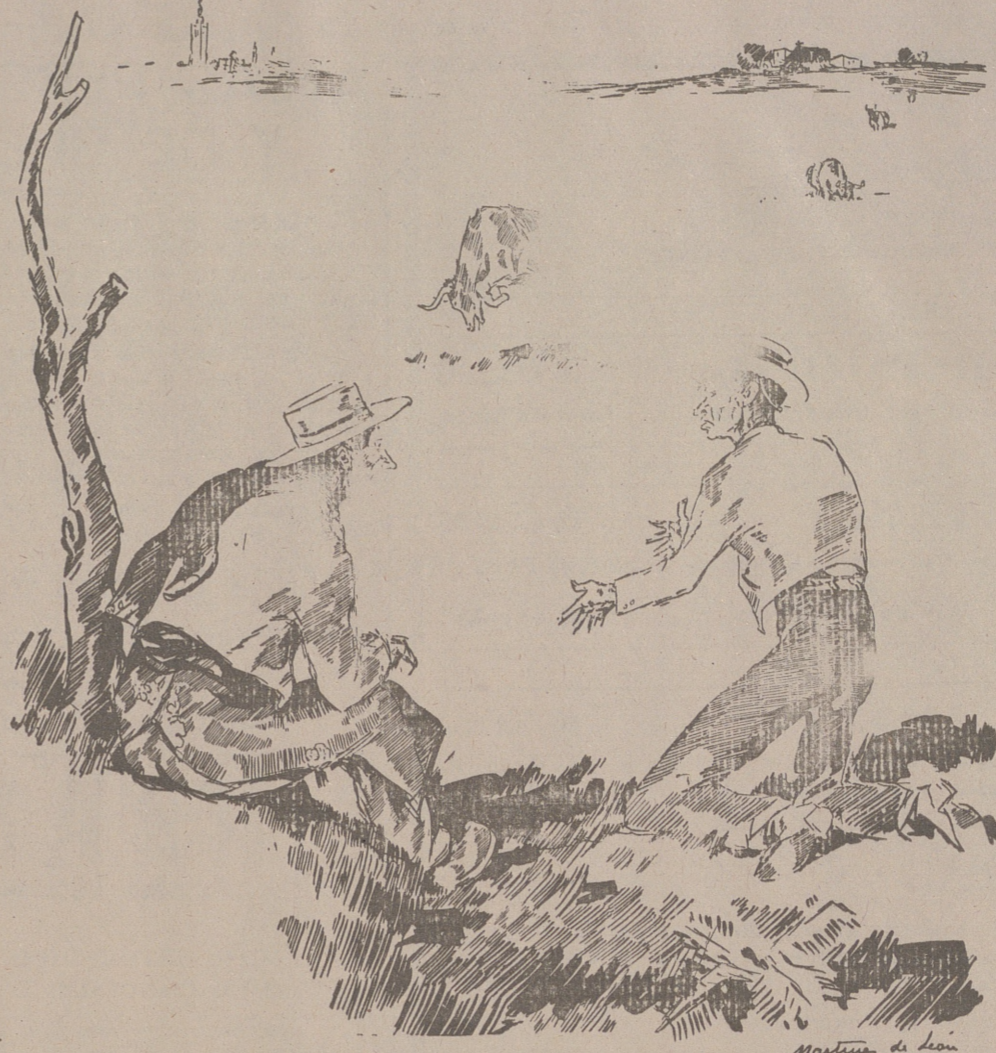
DOLOR DE MADRE , por Martínez de León —Que le pase a lo "Pitís", que rebince tanto! —Na, home, ilo Radio que tó lo charla y acaba de desu que le estan foguando en hijo suyo en Barselona!

¿CALLOS? Usado sólo tres días el patentado UNGUENTO MAGICO desaparecen totalmente callos y durezas, ojos de gallo, verrugas y juanetes Hay muchas imitaciones ineficaces En todas partes, 1'60 ptas. - Por correo, 2 ptas FARMACIA PUERTO, Plaza San Ildefonso, 5 - MADRID