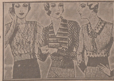
Blusas punto novedad, a 5, 6, 8, 10 y 12 ptas

Casa Munguía (Plaza Mayor, 48 y Lain Calvo) Sucursal: Plaza Mayor 5 BURGOS Primera casa en confecciones para caballero, señora, jóvenes y niños Tejidos, Pañería y Sastrería