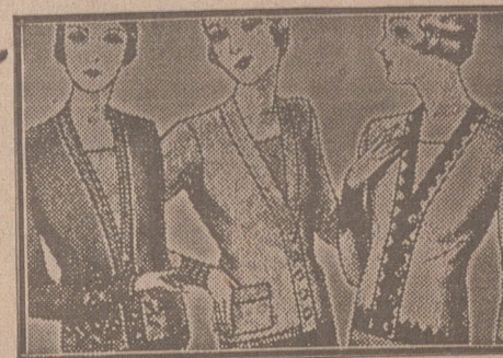
Blusas chaquéllas, de 7, 8, 10, 12 y 15 ptas.