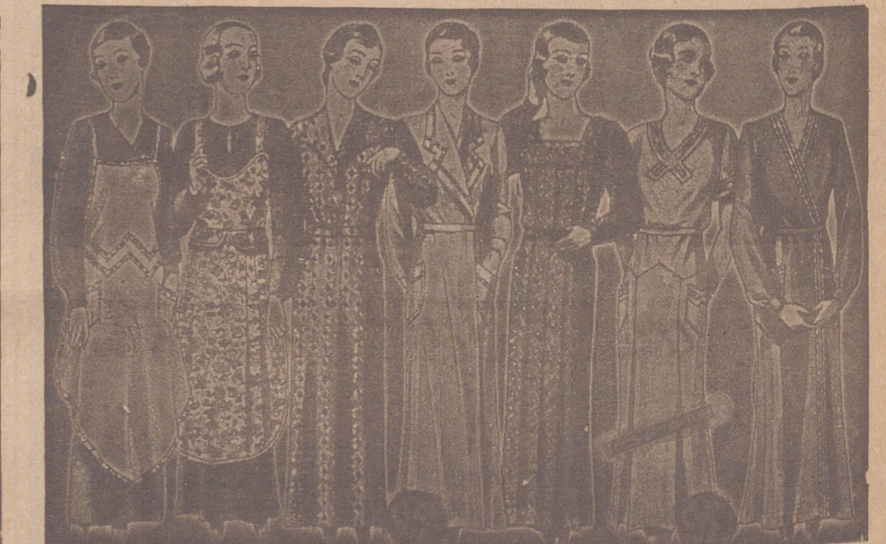
Vestidos, batas, kimonos de bañistas, percales o trovales, de 7, 8, 9, 10, 12 y 14 piezas

Casa Munguía Plaza Mayor, 48 y Lain Calve, 9 Sucursal: Plaza Mayor 5 BURGOS Primera casa en confecciones para caballero, señora, jóvenes y niños Tejidos, Pañería y Sastrería