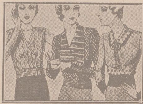
Blusas punto novedad a 5, 6, 8, 10 y 12 ptas.

Casa Munguía Plaza Mayor, 48 y Lain Calvo, 9 Sucursal: Plaza Mayor 5 BURGOS Primera casa en confecciones para caballero, señora, jóvenes y niños Tejidos, Pañería y Sastrería