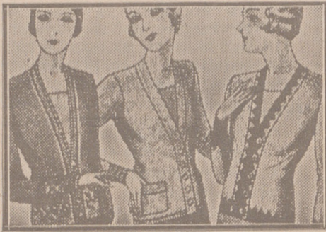
Blusas chaquetillas de 7, 8, 10, 12 y 15 ptas.