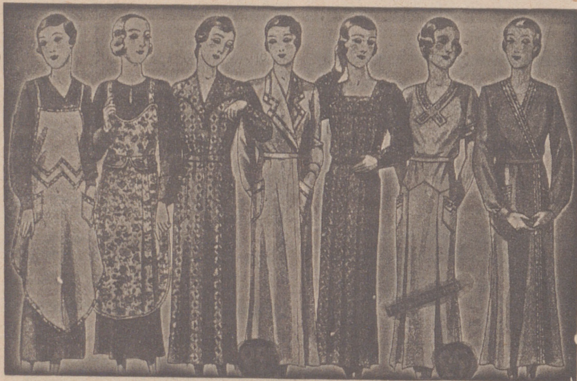
Vestidos, batas, blusas, blusas, percales o trovales, de 7, 8, 9, 10, 12 y 14 pies

Casa Munguía ( Plaza Mayor, 48 y Lain Calvo, 9 Sucursal: Plaza Mayor 5 BURGOS Primera casa en confecciones para caballero, señora, jóvenes y niños Tejidos, Pañería y Sastrería