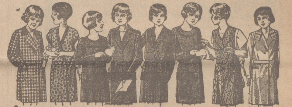
20 modelos distintos en vestiditos para niñas. En percal, de 6 a 10 años, de 4 a 6 ptas. En Trovalcos, de 6 a 10 años, de 5 a 7 ptas. En crespones seda, de 6 a 10 años, de 10 a 20 ptas.

Primera casa en confecciones para caballero, señora, jóvenes y niños Tejidos, Pañería y Sastrería