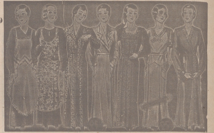
Vestidos, batas, kimonos de bañistas, percales o trovalcos, de 7, 8, 9, 10, 12 y 14 ptas

Primera casa en confecciones para caballero, señora, jóvenes y niños Tejidos, Pañería y Sastrería