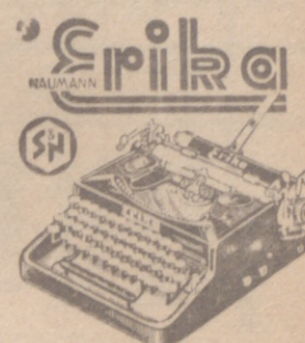
Tipo portable, reclado universal, tipos fortísimos, capaz para 12 copias legibles. 5 años de garantía. Única de tabulador automático.

SASTRERIA - CONFECCIONES Diego Porcelo, 1 y Sombrerería, 35. Teléfono, 1522 — BURGOS