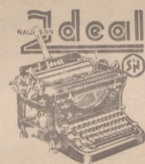
MAQUINA DE OFICINA Distintas dimensiones de carro. La mejor de las conocidas hasta hoy.