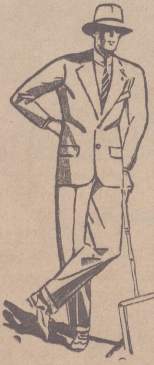
Trojes de paño confección fina, de 60, 70, 80, 100 y 120 pesetas. Grandes surtidos