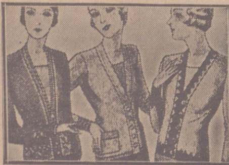
Blusas chaquetillas de 7, 8, 10, 12 y 15 ptas.