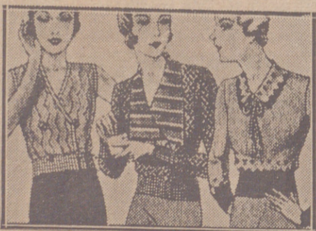
Blusas punto novedad a 5, 6, 8, 10 y 12 ptas.

Primera casa en confecciones para caballero, señora, jóvenes y niños. Tejidos, Pañería y Sastrería