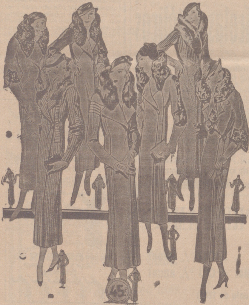
Abrigos señora, modelos novedad, a 20, 25, 30, 40, 50 y 60 pesetas. Abrigos para niñas, de 10, 12, 15 y 20 ptas. LA CASA MAS SURTIDA Y MAS BARATO VENDE

Primera casa en confecciones para caballero, señora, jóvenes y niños Teñidos, Pañería y Sastrería