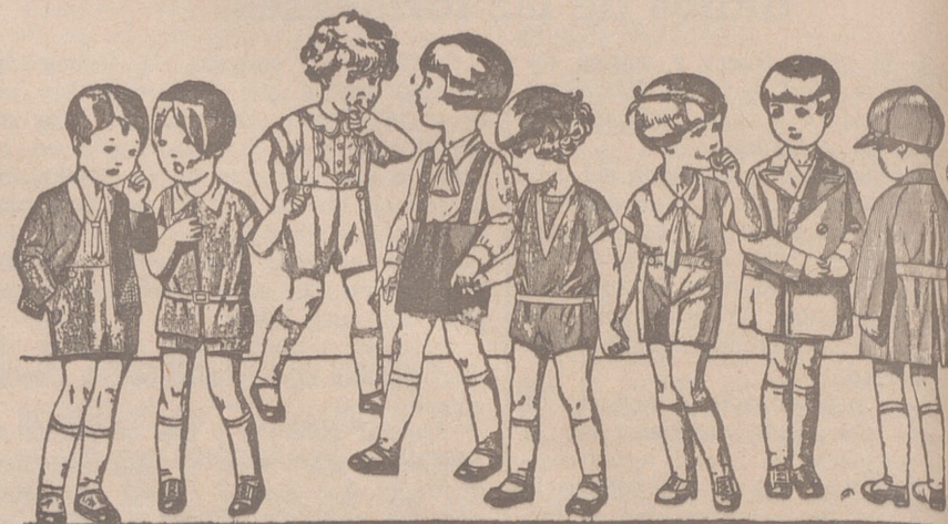
Diversidad de modelos en trajecitos para niños en punto, dril, lana o pana, de 5 a 15 ptas.

Primera casa en confecciones para caballero, señora, jóvenes y niños Tejidos, Pañería y Sastrería