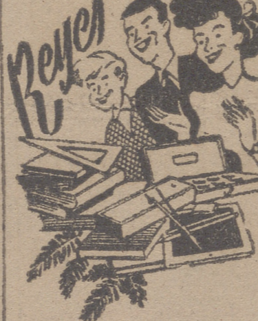
Para los niños, para los mayores, han dejado los Magos en nuestra Exposición los más bellos y prácticos regalos:

Montañas de cuentos. Primeros libros. Pinturas de todas las clases. Prácticas y bellas estilográficas. Juguetes y juegos originales. Libros de rica encuadernación.