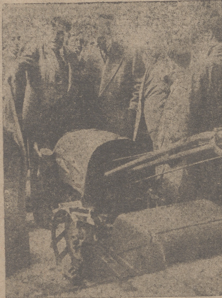
MADRID.—El ministro de Agricultura, señor Reñá, acompañado del subsecretario, director general del Departamento y numerosos ingenieros agrónomos, durante las pruebas oficiales de tres tipos de tractores agrícolas construidos por la industria española, celebrada en la Escuela de Ingenieros Agrónomos.

A ver si un día Carvajal se asoma a mi cuarto de la fonda y me encuentra rodeado de pequeños bichitos bailando la «craspa» mientras yo arranco lamento tras lamento una a una las cuerdas de mi violín.