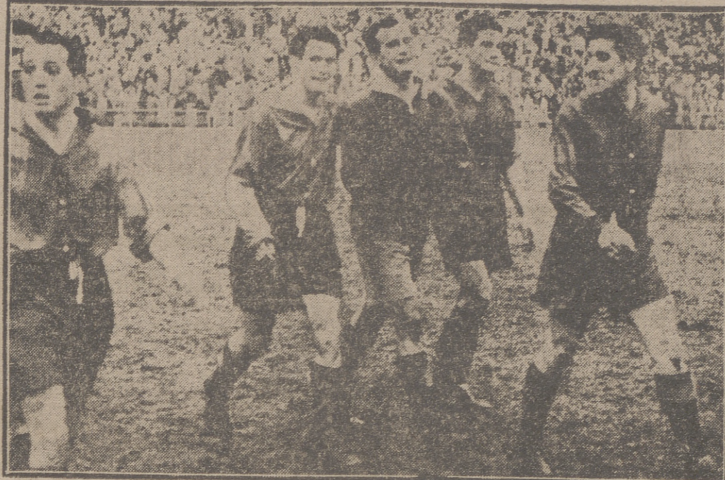
El árbitro acaba de pitar el final del encuentro. Los muchachos del «once» vallisoletano han conseguido puntuar fuera de su casa y ya puede considerarse como una victoria y así nos lo demuestran con sus caras sonrientes al marchar a la caseta.