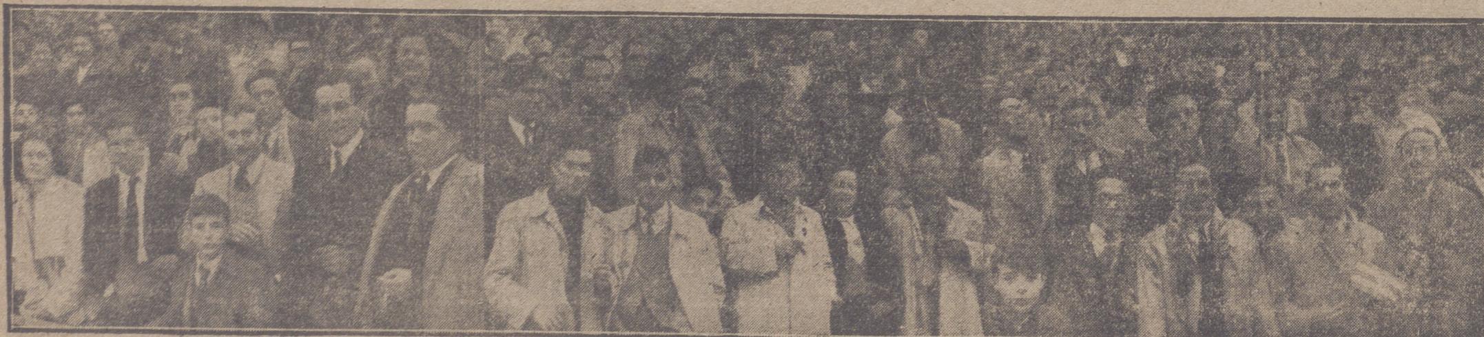
GRUPO DE «HINCHAS» VALLISOLETANOS RETRATADOS EN EL CAMPO DE CHAMARTIN

Artículos de pie para señora y caballero BAZARES GABINO SANCHEZ