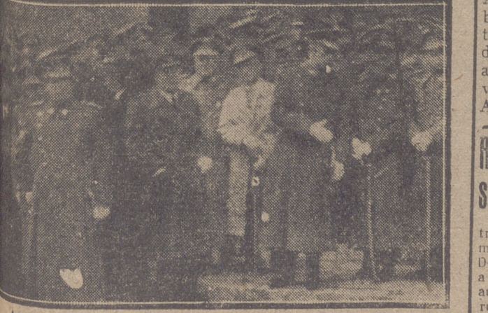
Autoridades asistentes a la misa de San Benito (INFORMACION EN LA PAGINA 4.)

El capitán general y otras autoridades militares y civiles presidieron el acto religioso de San Benito