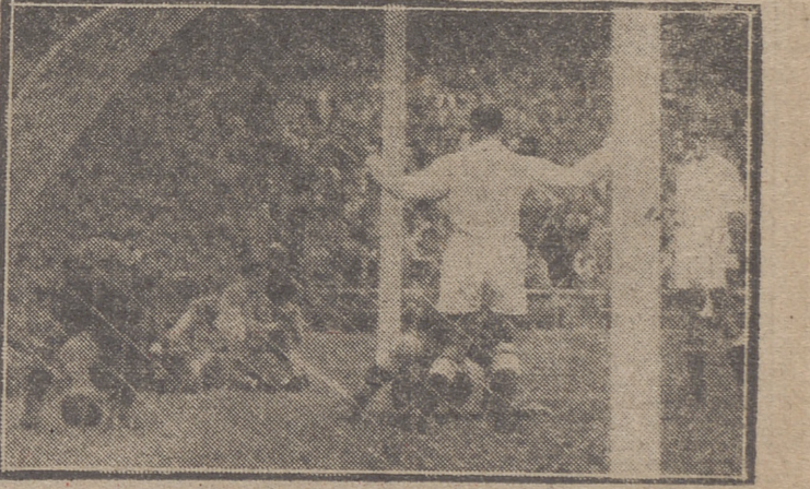
(Amplia información gráfica y literaria de este emocionante encuentro en páginas 6.ª y 5.ª)