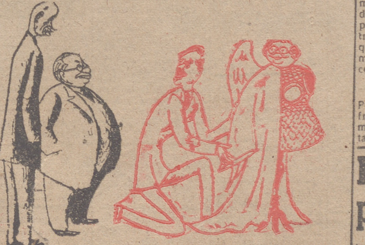
Para vuestra seguridad, he aquí la línea Acheson. (De 'L'Époque').