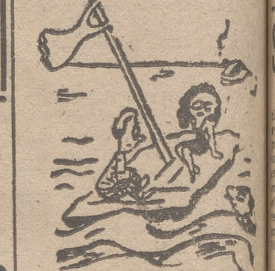
EL NAUFRAGO EDUCADO —¿Dan ustedes su permiso? —Sí, pero que usted no se manche.