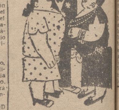
NUEVOS RICOS —¿Qué atrocidad, doña Tomasa! —¿Qué ostentación! —Pero si vengo "de trapillo" sin ninguna.— Sí, sí; pero trae usted en el vestido dos manchas de aceite.