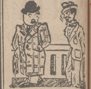
HOMBRE PRECAVIDO —¿Cómo usas ese sombrero feo? —Porque así no se lo llevan cuando me lo quito en alguna parte.