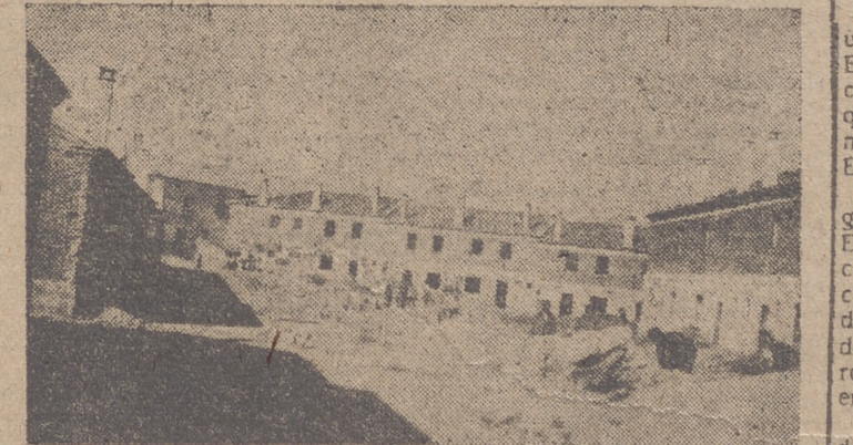
Grupo de viviendas en construcción de la Obra del Hogar que visitó (INFORMACION EN LA PAGINA QUINTA)