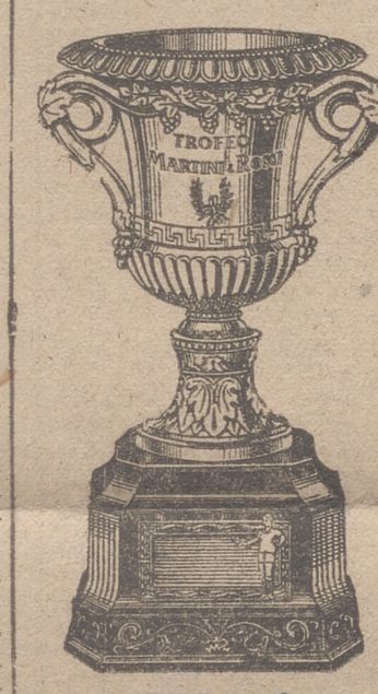
TROFEO MARTINI & ROSSI

Goles, goles, diluvio de goles, juego brioso y espectacular, ambición en el resultado. No basta ganar; hay que esforzarse para hacerlo con un elevado tanteo. En lugar del frío cálculo pensando sólo en los "puntos", ahora la Liga se juega con el pecho abierto a la codicia de sumar goles que agrandan la diferencia entre los favorables y los contrarios, con lo que el aficionado se frota las manos de satisfacción al presenciar partidos cada vez más interesantes. Es que ahora, junto a la Liga, está el Trofeo Martini & Rossi, maravilla de arte y de valor, creado por la Casa productora de tan popular vermut. Su clasificación en la novena jornada es: R. Madrid, diferencia.... 13 goles Barcelona » 12 » Valladolid » 11 » Como se ve, la diferencia que separa los primeros puestos es mínima y por lo tanto la jornada de hoy tendrá, a buen seguro, el altísimo interés de variarios sustancialmente. Atención, pues, aficionados, y mientras este mediodía estareis saboreando el exquisito vermut Martini & Rossi, haced cabales y propósitos sobre los apasionantes resultados de los partidos de la tarde.