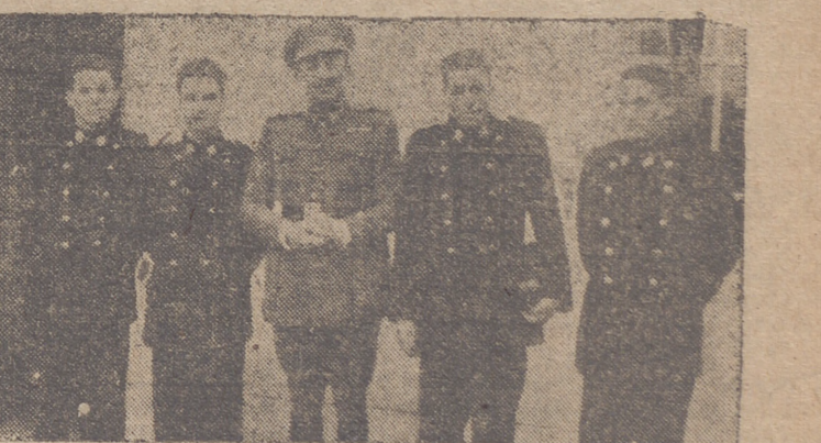
Grupo de aprendices premiados (INFORMACION EN LA PAGINA SEGUNDA)

Fué presidida por el Excmo. Sr. general Revilla, en representación del capitán general