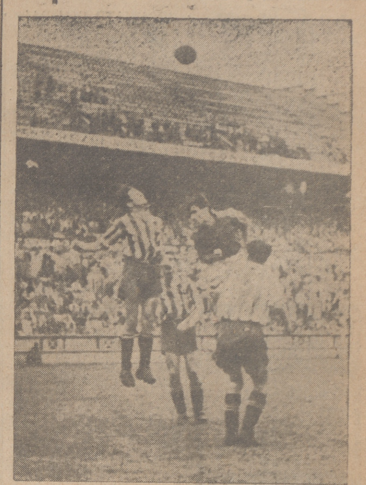
Martin y un delantero del Valladolid se disputan un balón