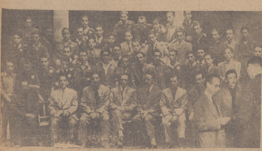
Entrega de premios por el Excmo. Sr. Gobernador Civil y Jefe provincial del Movimiento a los aprendices que tomaron parte en el concurso «Voluntad de Resurgimiento», organizado por el Frente de Juventudes