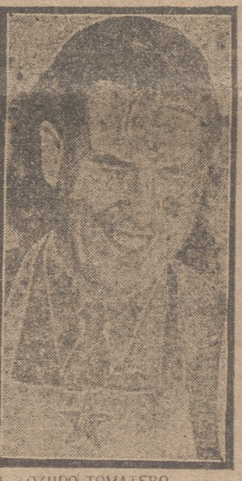
EL LOZUDO TOMAERO Wallace, con un mandilote con la estrella comunista de los cinco puntos

Al atardecer, la hija de Su Excelencia regresó a San Sebastián, Cifra.