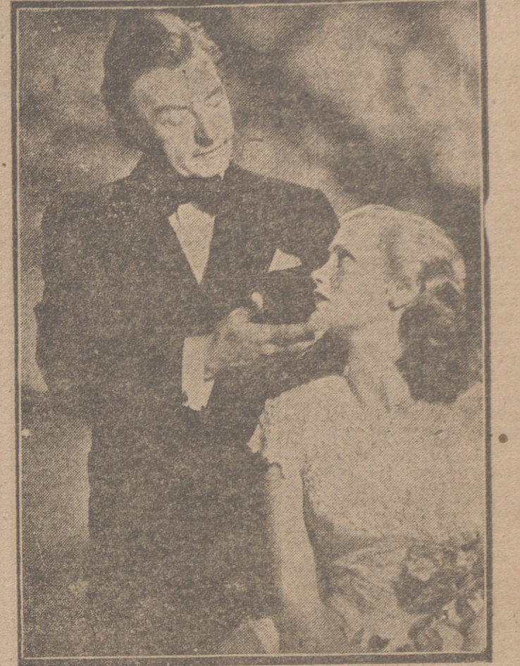
Claude Rains, el magnifico actor de carácter, es la figura central de "The unsuspected", película en la que logra la máxima creación de su carrera cinematográfica. Incorpora el primer papel femenino Joan Caulfield, una de las actrices mejor situadas en la actualidad en Hollywood