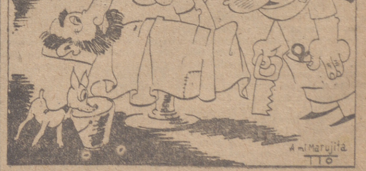
—¿Qué va a ser? —Afeitarse.