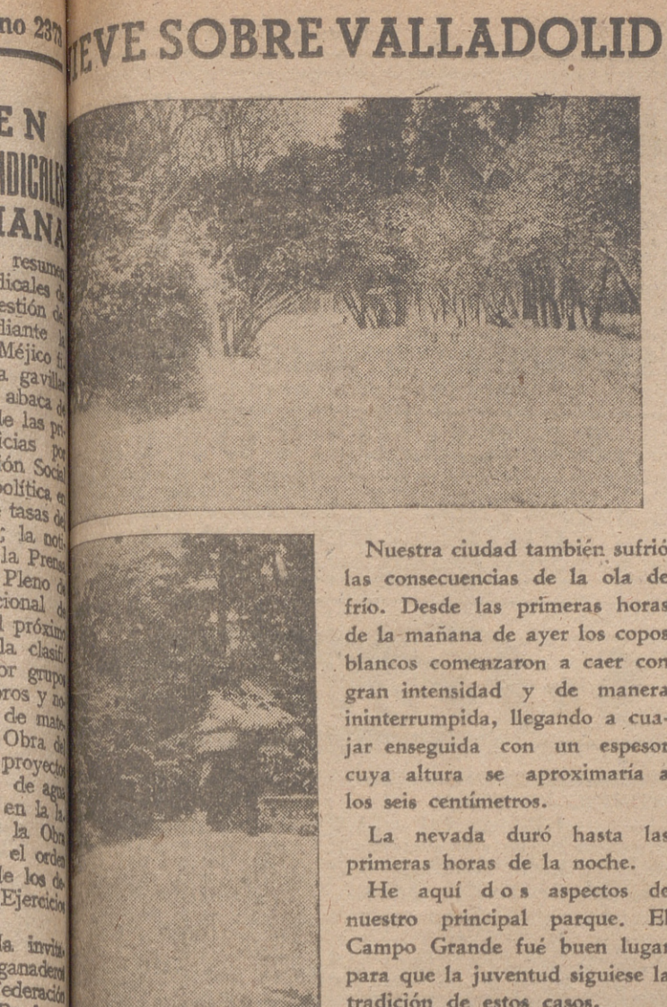
Resaca de nieve sobre Valladolid

Trieste, 21.—Oficialmente se confirma que ha habido un intenso tiroteo entre los destacamentos fronterizos italianos y los yugoslavos, cerca de Gorizia, motivado por la entrada de una patrulla yugoslava en territorio italiano para quitar los postes indicadores de la frontera provisional. Los yugoslavos fueron invitados por las patrullas italianas para que desistieran de retirar dichos postes, y como se negaron, los italianos abrieron fuego retirándose los yugoslavos a su territorio no sin contestar también con sus armas. Un destacamento de «carabinieri» se unió más tarde al tiroteo. No hay noticias de que se hayan registrado bajas. El general italiano Gloria llegó poco después de comenzar la lucha y después de una discusión con los oficiales yugoslavos quedó resuelta la cuestión y los indicadores de la frontera fueron colocados de nuevo en sus respectivos lugares.—Efe.