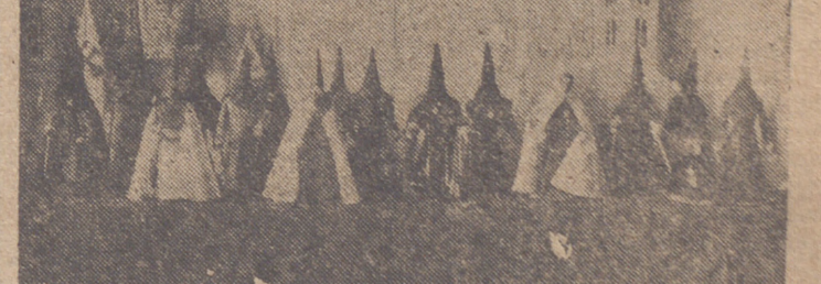
Lo que nos dijo el autor de las maquetas (Información en página 10)

Trieste, 21.—Oficialmente se confirma que ha habido un intenso tiroteo entre los destacamentos fronterizos italianos y los yugoslavos, cerca de Gorizia, motivado por la entrada de una patrulla yugoslava en territorio italiano para quitar los postes indicadores de la frontera provisional. Los yugoslavos fueron invitados por las patrullas italianas para que desistieran de retirar dichos postes, y como se negaron, los italianos abrieron fuego retirándose los yugoslavos a su territorio no sin contestar también con sus armas. Un destacamento de «carabinieri» se unió más tarde al tiroteo. No hay noticias de que se hayan registrado bajas. El general italiano Gloria llegó poco después de comenzar la lucha y después de una discusión con los oficiales yugoslavos quedó resuelta la cuestión y los indicadores de la frontera fueron colocados de nuevo en sus respectivos lugares.—Efe.