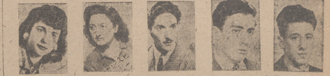
Escuela Elemental de Actores. Alumnos más destacados de la