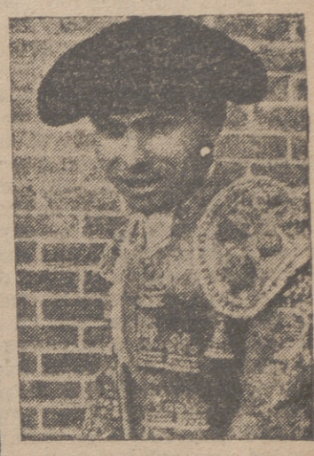
¡Fíjense todos en el peligro que trae anejo esto de torear por fuera de las plazas los toreros, y aficionar al público a que el toro se lidie en zonas callejeras! Hay que volver al circo todos.

(Servicio de exclusivas) Es curioso el fenómeno. Ahora, cuando los viejos aficionados se quejan de que el toro es demasiado chico y entorpecen los ojos para hablar con nostalgia de "Jaquetón" y "Barrabás", resulta que el toro es ya tan grande que no cabe en la plaza.