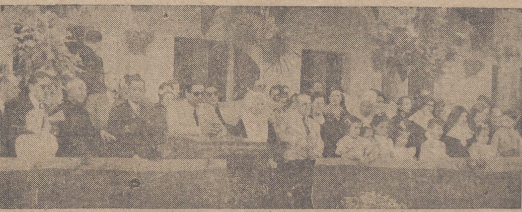
Ayer se celebró en el Orfanato Provincial un festival gimnástico y el reparto de premios de fin de curso. La foto muestra la presidencia del acto. (Información, pág. 3.)