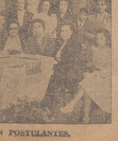
UNA MESA CON POSTULANTES.

Con este motivo, LIBERTAD felicita al venerable Prelado y ruega a sus lectores eleven sus oraciones al Señor para que le conceda larga y próspera vida, llena de bendiciones para la Diócesis y la Santa Iglesia.