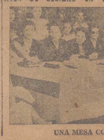
UNA MESA CON POSTULANTES.

Berlin, 12. — El jefe de las fuerzas norteamericanas en Berlín, Frank L. Howly, ha manifestado a los periodistas alemanes que el Gobierno militar norteamericano «no piensa impedir o poner obstáculos a la socialización en Alemania, siempre que así lo desee el pueblo alemán».