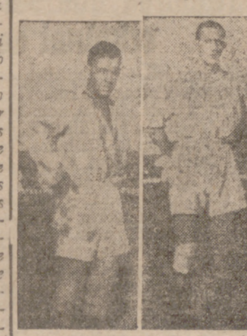
El partido de Zamora tiene un gran interés para nuestro equipo, ya que una victoria en Pantoja sería ideal para ratificar la magnífica situación de nuestro equipo en la tabla de clasificación con un haber de cinco puntos positivos antes de terminar la primera vuelta de la Liga.

Al parecer el Zamora atraviesa un mal momento, y debe