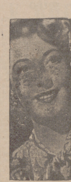
Pamela Britton es conocida en Hollywood como "La chica de los hoyuelos".

Cuando apareció en la producción teatral "Oklahoma", todos los críticos que se refirieron a Pamela hicieron alusión a sus característicos hoyuelos.