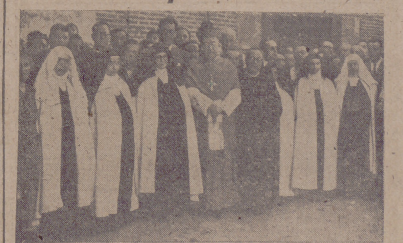
Oció el excelentísimo y reverendísimo señor Arzobispo.—(Información en página tercera.)

Los objetivos de estos ataques han sido: el arsenal naval de Kure; la fábrica de aviones Mitsubishi y Wawasaki, en Kagamiyama, al norte de Nagoya; la fábrica de aviones de Kawanishi, en Akashi, 16 kilómetros al norte de Kobe, y la fábrica de bombarderos de Mitsubishi y Mihima, en Takasima.