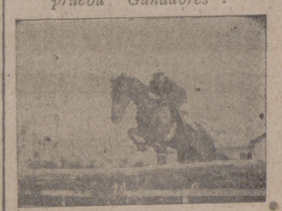
Giménez, con "Simón", en un magnífico salto.