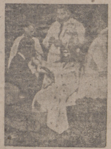
Integran el grupo ferroviario de A. C. Finalmente, el reverendísimo Prelado pronunció una fervorosa ablocución...

El pasado domingo tuvo lugar el solemne acto de imponer las insignias al grupo ferroviario de Acción Católica en el Santuario Nacional.