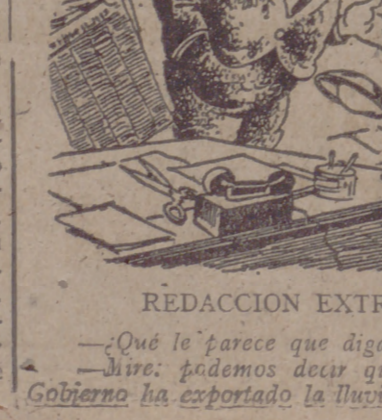
REDACCION EXTRANJERA.—Por Esemé.

Con tu donativo del día 13 de mayo contribuirás a que una camarada flocha haga su cura de reposo en una Estación Preventoria.