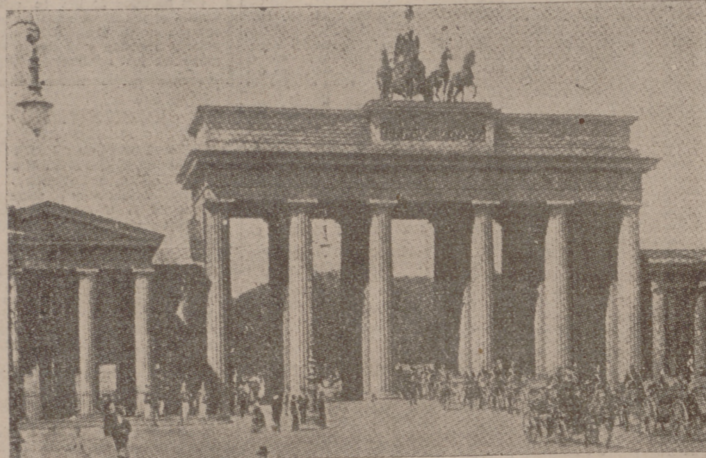
LA PUERTA DE BRANDENBURGO

El cronista no puede sustraerse al horizonte sombrío que nos envuelve. Jamás como ahora, cuando la guerra decididamente fina, se levantaron ante los ojos del comentarista y del observador interrogantes mayores ni más graves. Las novedades militares señalan el ataque ruso sobre Berlín, cuyo perímetro exterior inmenso cubren ya los bolcheviques en una extensión, aproximadamente, de tres cuartidas partes. Las informaciones añaden que los soviéticos fisgan ya el núcleo central de la gran urbe, ocupando la estación de Potsdamer. Las referencias oficiales germánicas, incluso, citan un dato concreto y singularmente expresivo: Hitler y Goebbels—advertido éste a través de los últimos acontecimientos como el más directo representante junto al Führer del Partido Nacional-socialista—se han encargado de la defensa de la capital del Reich. Esto parece presuponer