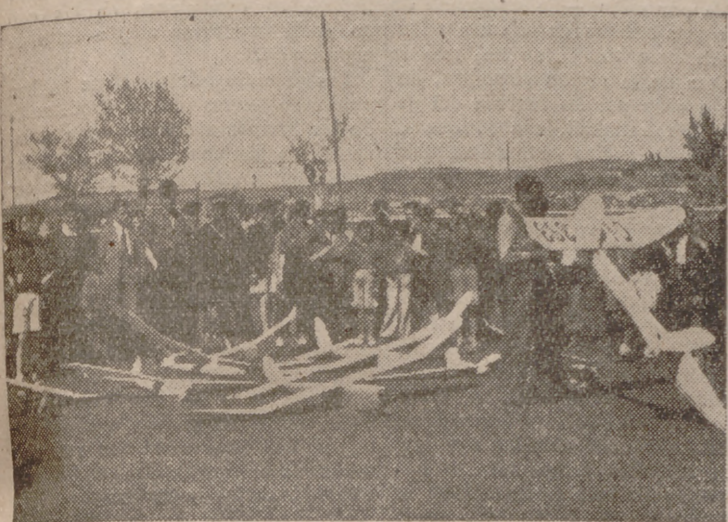
Un momento de las pruebas.

Se lanzaron numerosos aparatos construidos por los alumnos del Frente de Juventudes