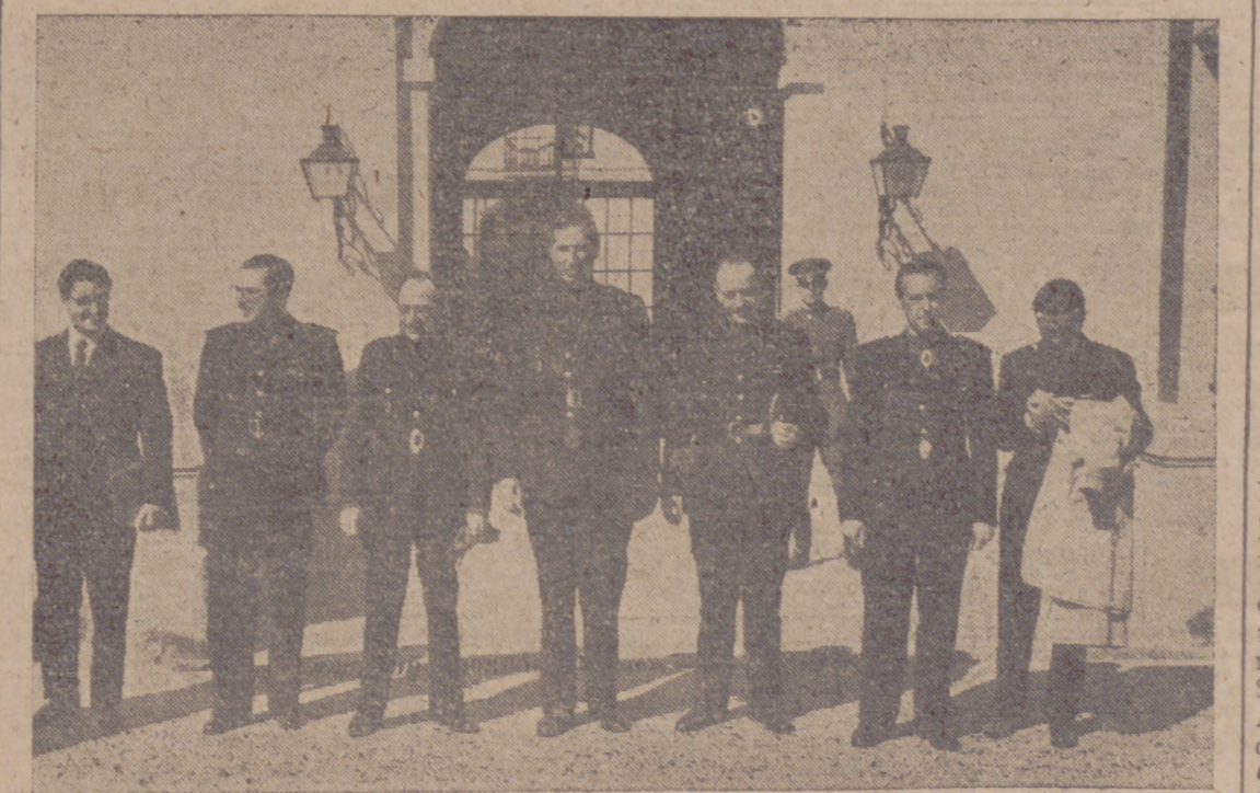
Los delegados sindicales, presididos por el vicesecretario de Obras Sociales y delegado nacional de Sindicatos, a la puerta del Palacio de El Pardo después de entregar a S. E. el Jefe del Estado las conclusiones del III Consejo Sindical Industrial y un resumen de la labor realizada por la Obra Sindical de Colonización.