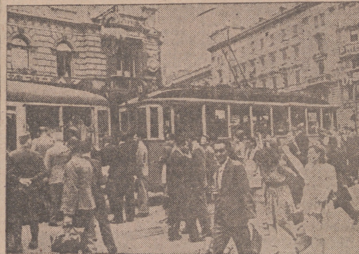
Aunque Budapest tiene cerca la guerra, sus calles ofrecen aspectos también de normalidad ciudadana.