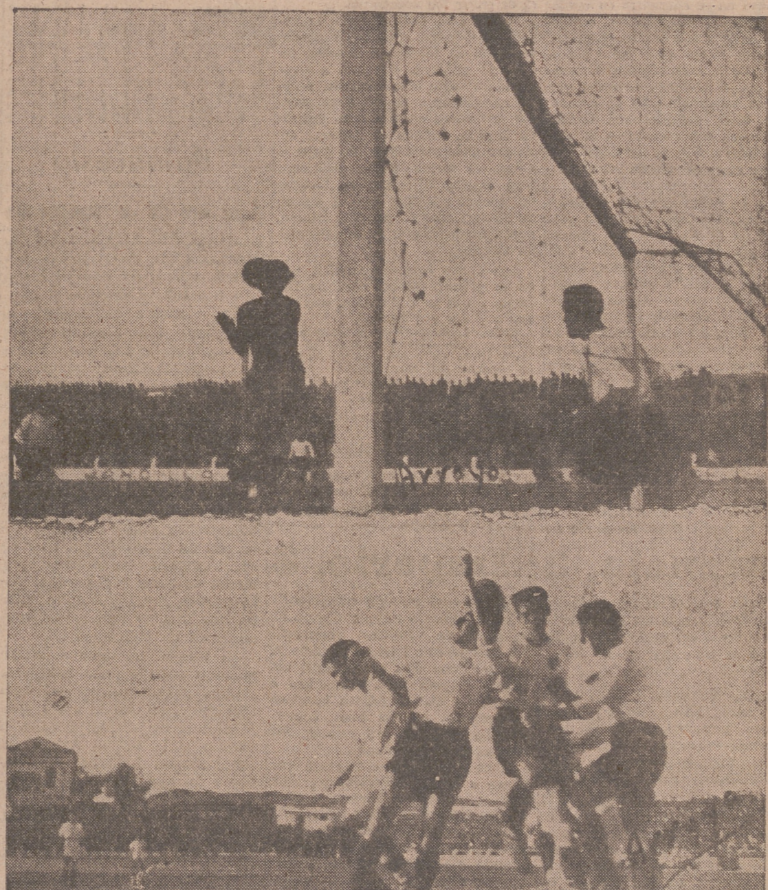
Arriba: Salinas para tranquilamente una pelota que le llega a las manos.—Abajo: Una melé ante la puerta salmantina que demuestra el coraje de los charros.

(De nuestro enviado especial LUIS ANGEL)