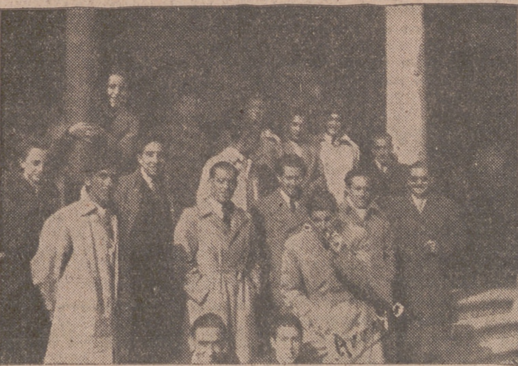
Un grupo de jugadores y aficionados vallisoletanos, momentos antes del encuentro.

Desde el comienzo de la temporada y a la vista de los refuerzos traídos al club local, hemos dado la voz de alarma. El Valladolid no tenía este año el conjunto necesario para salir de la Tercera División. A lo largo de los partidos, todos hemos podido comprobar, perfectamente que ni la media respondía ni en la delantera había efectividad alguna, y como consecuencia que el conjunto distaba mucho de ser el que se requiere para alcanzar una meta tan ambiciosa como la de salir del complicado mecanismo de la Tercera.