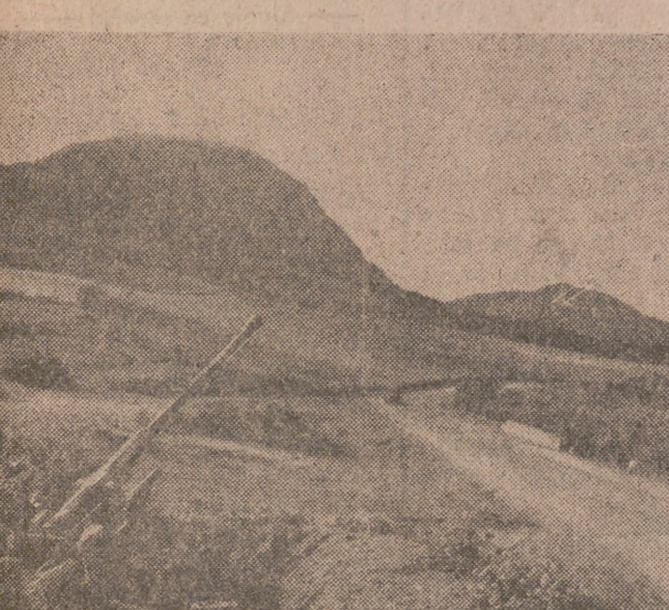
Una batería antiaérea ligera alemana, preparada para proteger el paso de un convoy por una carretera.

EL DIRECTOR DEL OBSERVATORIO DEL EBRO ASISTIRÁ AL CONGRESO HISPANO-LUSO PARA EL PROGRESO DE LA CIENCIA