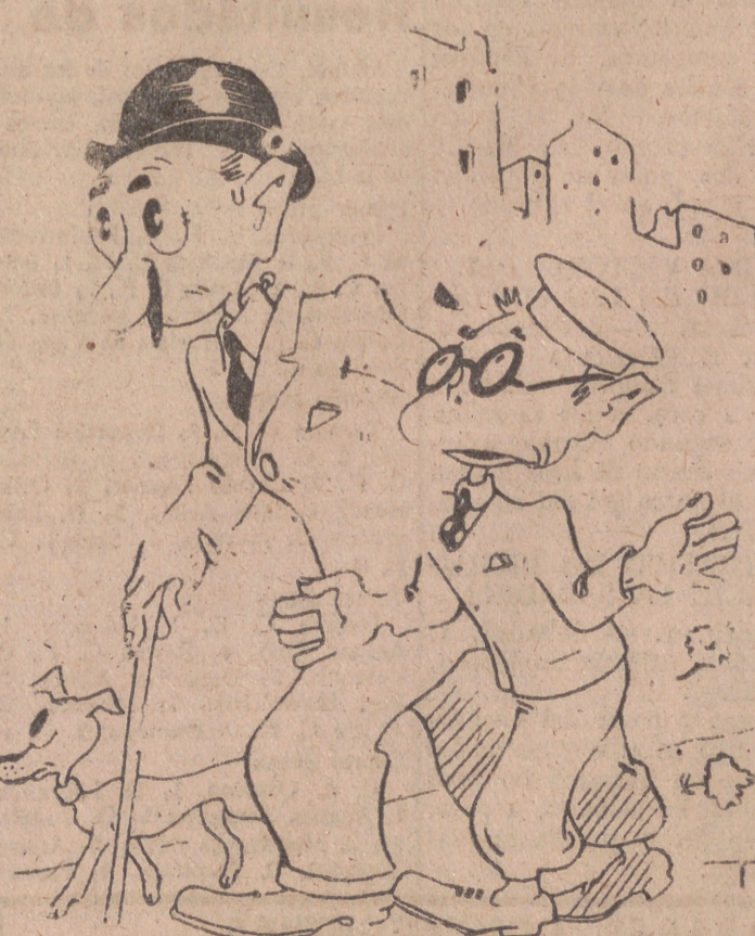
PARTIDOS DE FUTBOL CON REGALOS, por ITO. —Para el Valladolid, todos estos partidos deben ser «bebidos»; pero falta algo. —La delantera... —No; la fuente de vino.