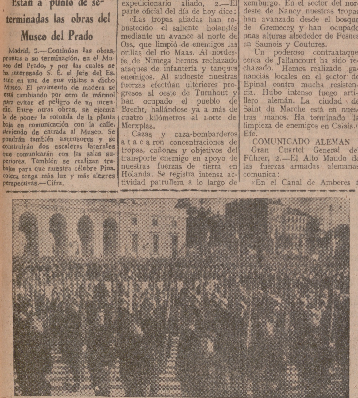
MADRID.—Un aspecto de la magna concentración de las Falanges Juveniles de España celebrada ante el Jefe del Estado, Generalísimo Franco, con motivo del «Día del Caudillo».