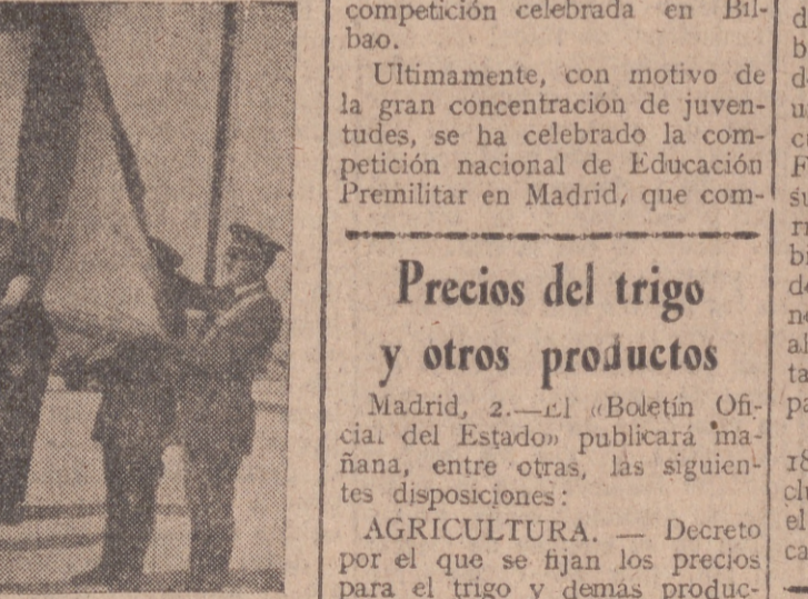
Ayer lunes, día 2 de octubre, tuvo lugar en este aeródromo la jura de la bandera de los reclutas del Ejército del Aire...

El acto, presidido por el general Rubio, tuvo lugar en Villanubla