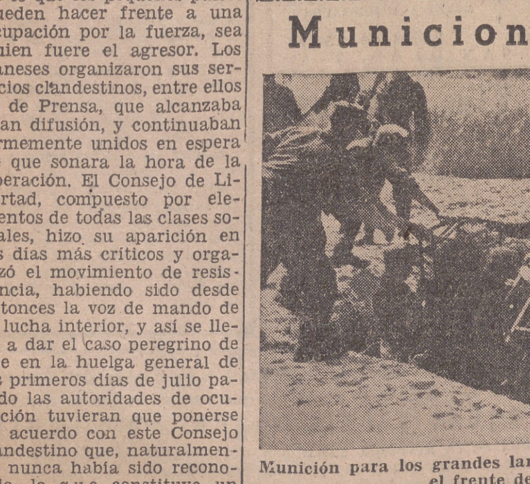
Munición para los grandes lanzagranadas alemanes en el frente del Oeste.