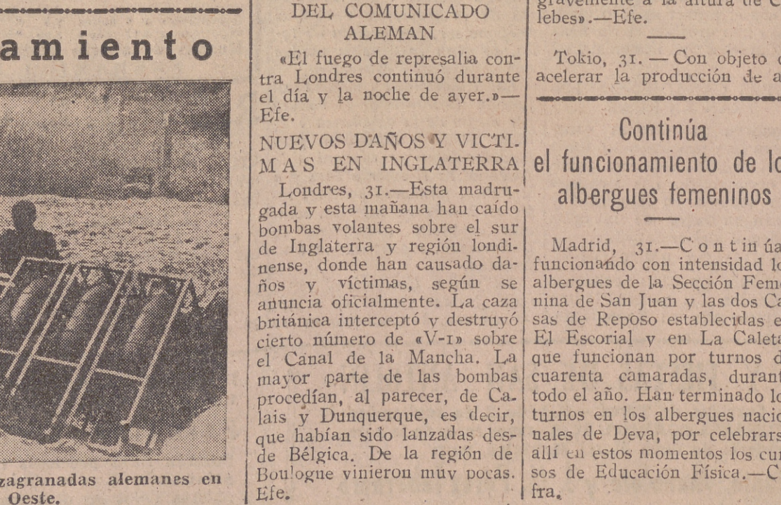
Munición para los grandes lanzagranadas alemanes en el frente del Oeste.

Municionamiento. Londres, 31.—El general Montgomery ha sido ascendido a mariscal.