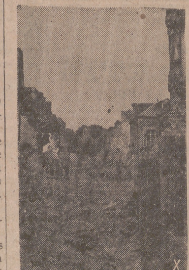
Una de tantas ciudades francesas destruidas por las luchas y los bombardeos.