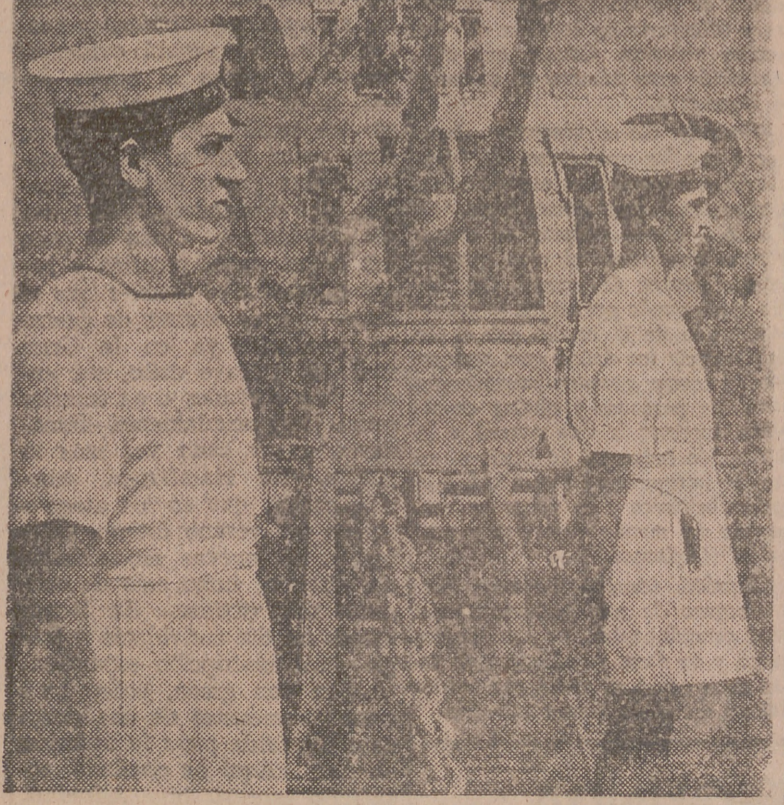
Dos marinos indios de un destructor de la Marina india forman en cubierta al entrar el buque en un puerto aliado después de haber dado escolta a un convoy.