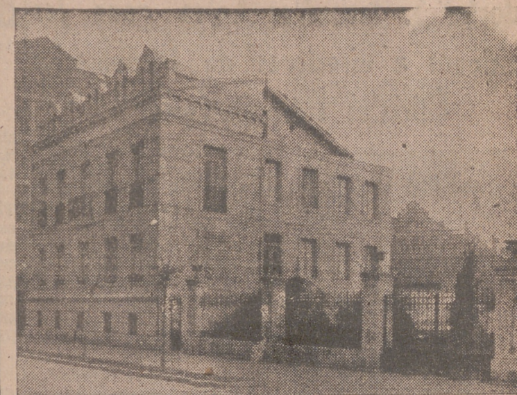
Edificio donde están instalados los servicios de la Obra «18 de Julio».

Berzosa nos expresa sus deseos y los del Movimiento de llevar paulatinamente a cabo algunos proyectos. Entre ellos son la construcción de edificaciones anejas en el mismo local—propiedad de la Obra—en que empieza ahora a funcionar la Policlínica, y aprovechando para ello los jardines existentes.