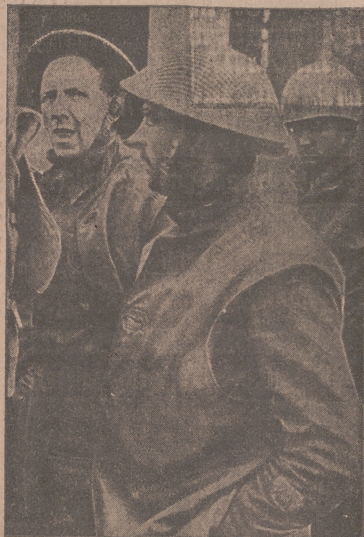
Prisioneros aliados capturados por las tropas alemanas en el sector de la cabeza de puente de Nettuno