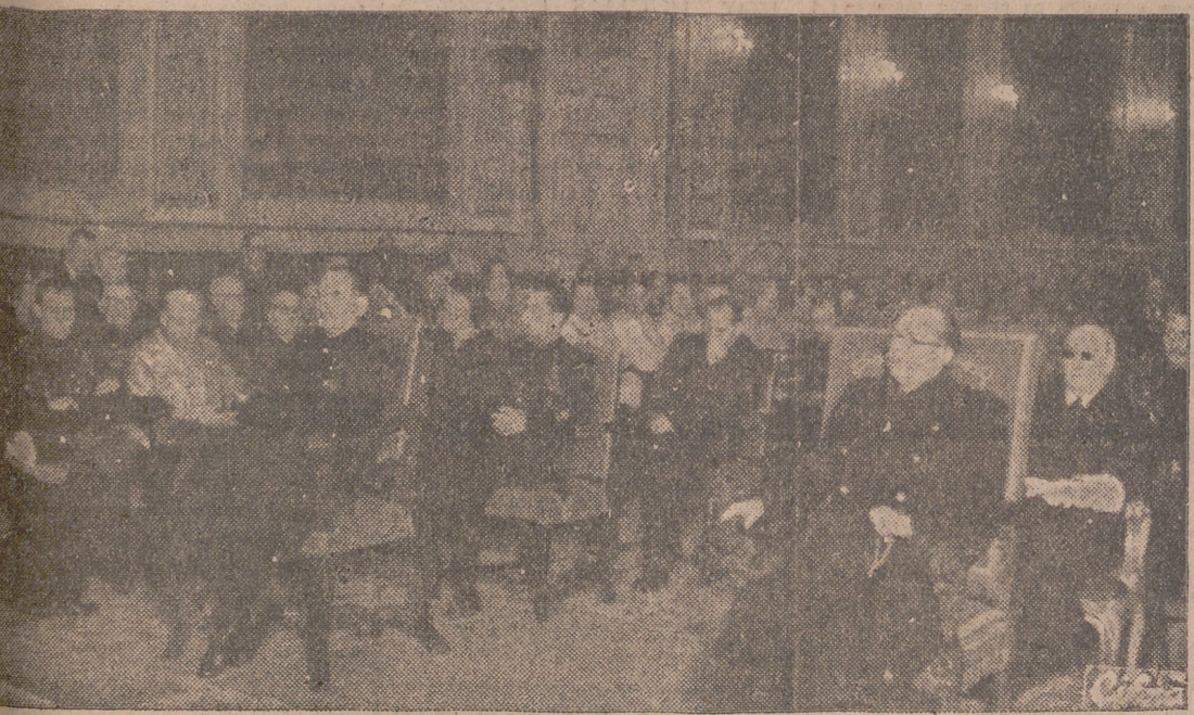
Con asistencia de los ministros secretario general del Movimiento y de Educación Nacional, se celebra en el Paraninfo de la Universidad una misa del Espíritu Santo con motivo de la festividad de Santo Tomás de Aquino.