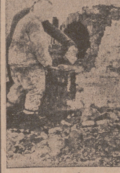
Estos soldados alemanes aprovechan las ruinas de un caserón en el sector de Witelsch para construirse un buen refugio.