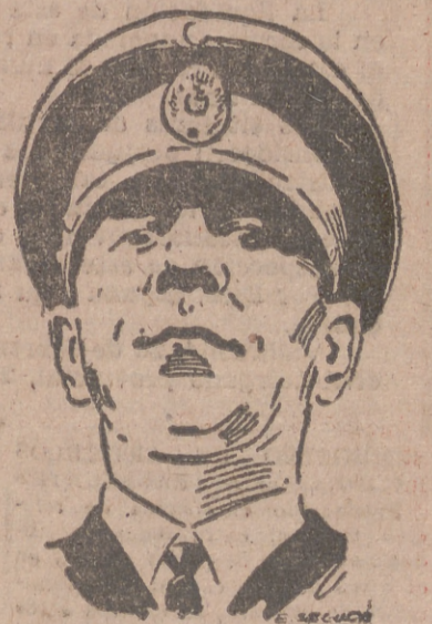
Edelmiro J. Farrell

Buenos Aires, 26.—El general Farrell, que ha asumido las funciones presidenciales, ha declarado que la duración de su mandato es indeterminada, ya que el general Ramírez sigue siendo presidente. «No sé—añadió—la labor que podré llevar a cabo y la que dejaré sin hacer. En ella seguiré el camino que considero beneficioso para la nación».