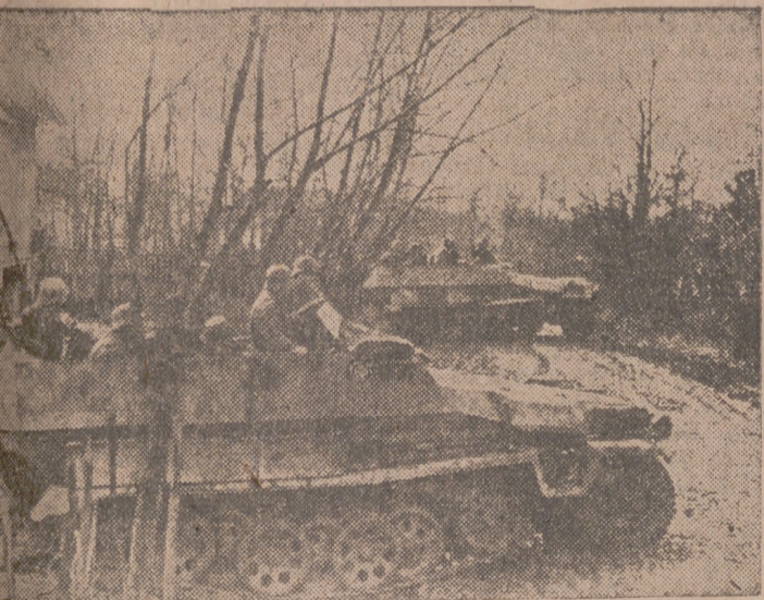
Una vez localizado el lugar en que se encuentran los francotiradores, una unidad de carros de asalto alemanes se dispone a infligirles duro castigo.