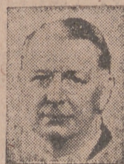
Washington, 26.—El secretario de Marina, Knox, declaró hoy a los periodistas que la Flota japonesa es posible que se haya retirado a sus aguas metropolitanas o a las Filipinas. Añadió que el empleo de acorazados

en el ataque contra Truk pone de relieve el dominio aliado en el mar.