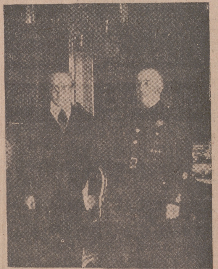
Madrid.—S. E. el Jefe del Estado, Generalísimo Franco, recibe en audiencia al doctor don Carlos Jiménez Díaz.