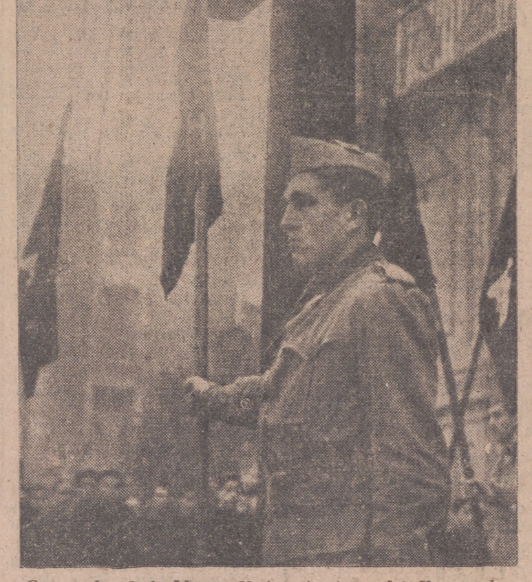
Camaradas de la Milicia Universitaria y del Frente de Juventudes, haciendo guardia ante la Cruz de los Caídos.

En el local de la Sección Femenina, gran número de camaradas allí reunidas rezaron un rosario por el alma de los estudiantes caídos. Presidió el acto la regidora de la Sección Femenina del Distrito Universitario.