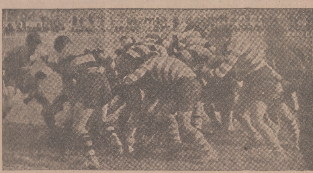
Una melé que ganó Derecho

En el Estadio contendieron ayer los equipos de Medicina y Derecho en un partido de Rugby, que presentó un número de público.