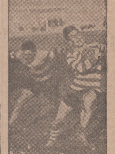
Un buen avance de Medicina

Suponemos que Planas habrá emitido su informe y a la vista de él la Directiva habrá iniciado las gestiones para el traspaso, que al parecer no es nada fácil, ya que otros equipos se interesan por este jugador.