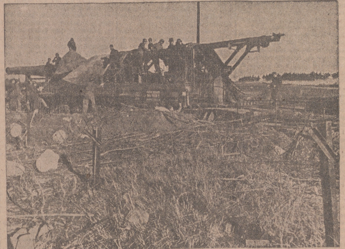
El duelo de la artillería ha terminado y la pieza es camuflada nuevamente para hacerla invisible a la vista de los aviones de reconocimiento enemigos.