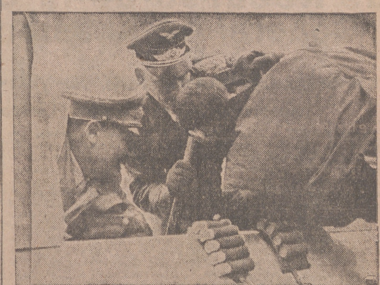
Aquí asiste a los preparativos de un aparato antes de partir en vuelo hacia el enemigo.