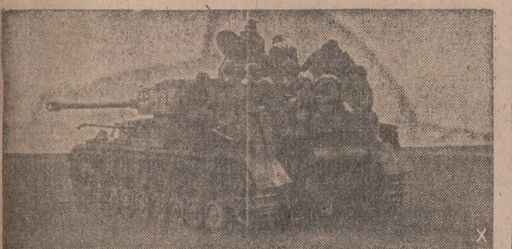
En dirección al frente de batalla marchan tanques con granaderos alemanes.