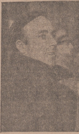
CORTON sonríe satisfecho esperanzado de vencer en San Mamés.

Para este fin ayer llegaron a Valladolid dos miembros de la citada Federación, los cuales se pondrán de acuerdo con los más calificados aficionados al atletismo vallisoletano para organizar la Delegación que hoy quedará constituida.