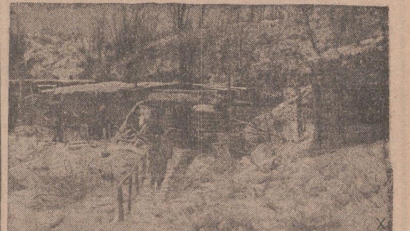
En un fortín del Este descansan los soldados y de allí pasan al puesto de vigilancia, a través de planchas especiales, para relevar al centinela de la trinchera.