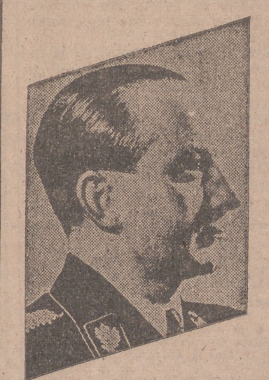
París, 15.—El jefe de Prensa del Reich, doctor Dietrich, ha expuesto a los periodistas franceses, en la

Declaraciones del ministro alemán, doctor Dietrich