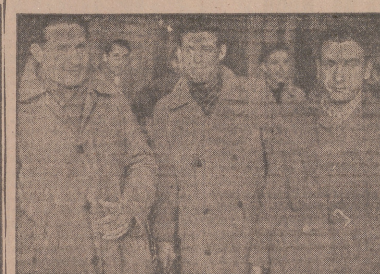
Un grupo de jugadores con el masajista y el delegado del Club, pasean por el andén esperando el tren que les lleve a Bilbao.

El empresario de la plaza de Castellón de la Plana ha ultimado el contrato de Pepe Luis Vázquez, que