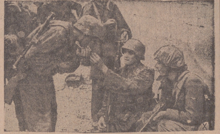
Después de horas de combate, estos soldados alemanes reposan fumando un cigarrillo.