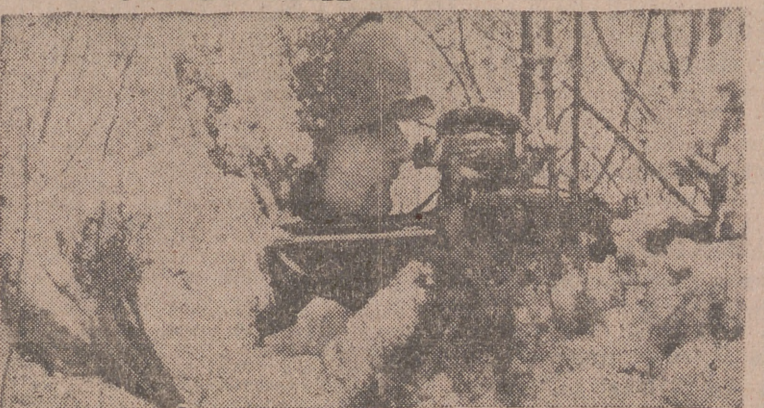
Invisible para el enemigo, vamos a este soldado, en su puesto de vigilancia, con su «anorak» de piel cubierto de nieve.