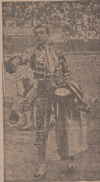
JOSE GOMEZ ORTEGA «Joselito»

—Dende que era asín, un mocuelo que no levantaba un parmo del suelo, va quería ser torero—, le dijo el padre de los toreros, que también tuvo su personalidad en la profesión. Cuando nos vinimos a residir a esta huerta de Gelves, y en vista de la enorme afición que tenía Rafaelillo y Fernando, y José, sí, José también, zeño, mandé construir una placita que fuera como una escuela para sus aficionados y de la que yo soy el maestro. —Entonces—dijo el periodista—, sus hijos tienen sangre torera. —Azí es, zí zeño; sangre torera y de la que hierve y parece que va a explotar. Cuando ambos sostenían esta conversación, dentro de la placita se oían olés y «jaleos».