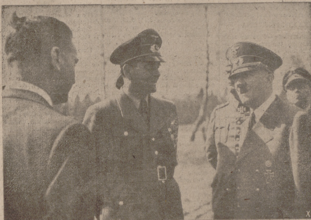
El ministro de Armamento, Speer, durante una de sus frecuentes entrevistas con el Führer, dándole información exacta sobre la nueva fabricación de armas y municiones secretas.