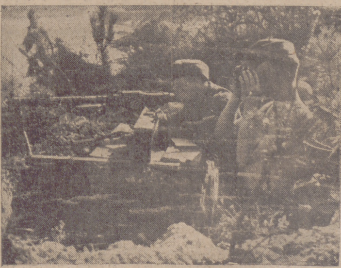
Con gran éxito actúa el batallón de voluntarios de Estonia en el frente de defensa, en un sector de la orilla occidental del Dnieper.