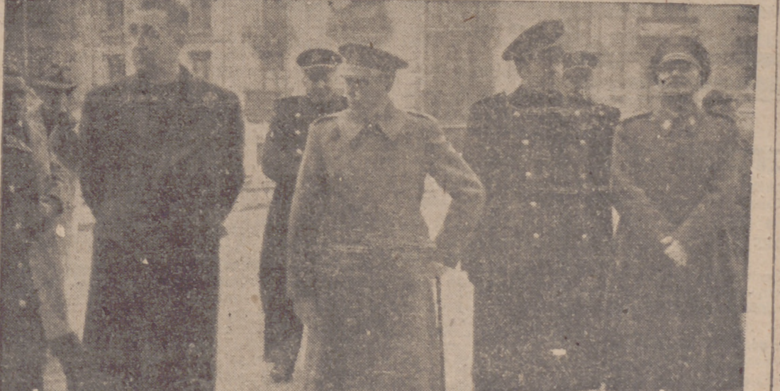
Autoridades y jerarquías que presidieron los actos celebrados ayer en la Catedral en memoria de José Antonio.

Se señalan vivos combates locales en el sector de penetración del Sudoeste de Nevel.—Efe.