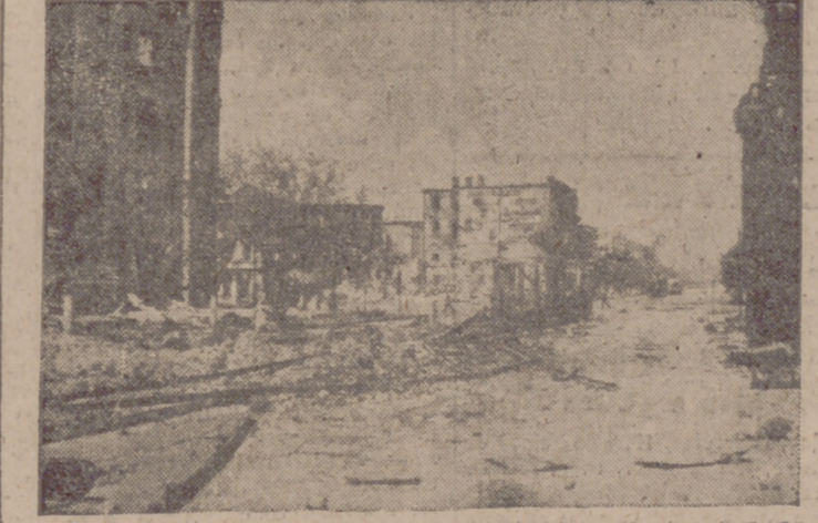
Efectos de un bombardeo por «Stukas» en una ciudad del sector ruso.