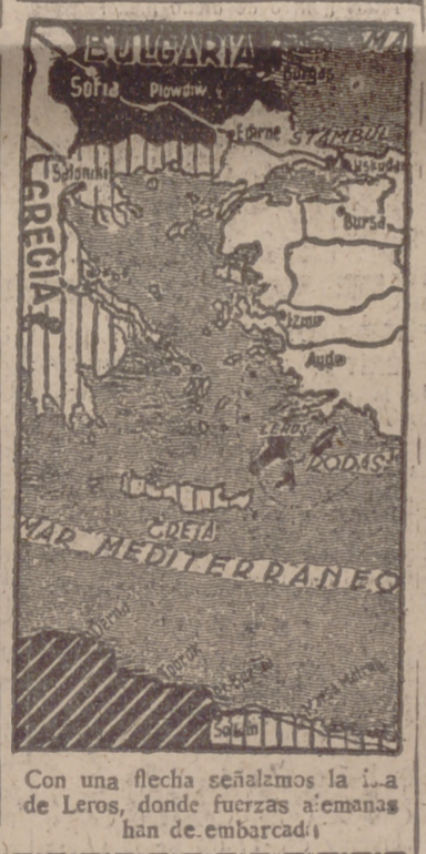
Con una flecha señalamos la línea de Leros, donde fuerzas alemanas han de embarcarse.

En el sector de Jitomir reconquistan los alemanes varias posiciones