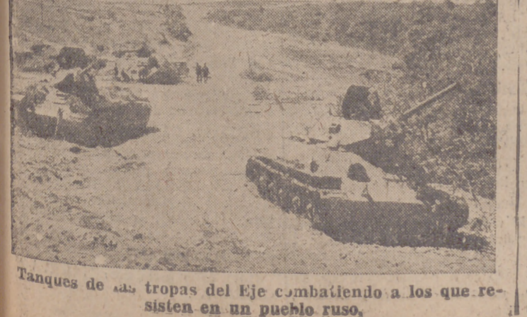
Tanques de las tropas del Eje combatiendo a los que resisten en un pueblo ruso.