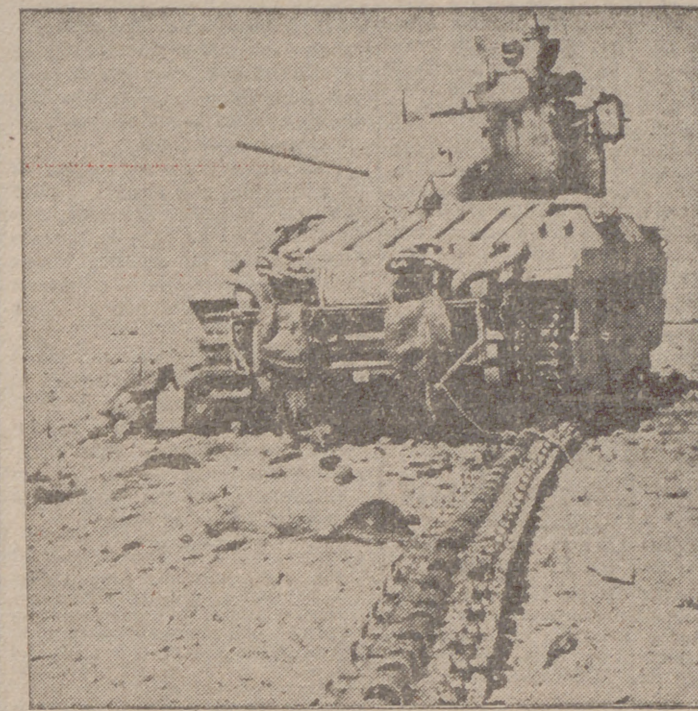
Tanque británico destruido