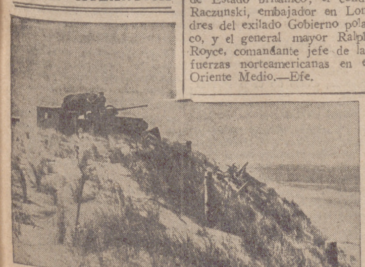
Curioso aspecto de un nido de ametralladora alemán en la costa atlántica