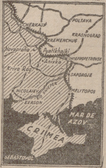
El sector de Kremenchug, nuevo punto neurálgico en la batalla del Dnieper