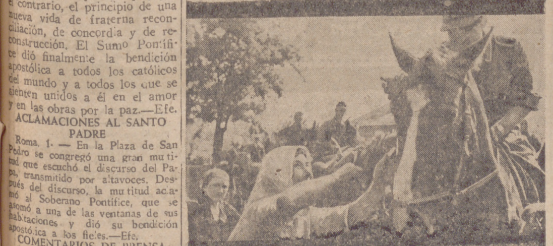
El jefe de una sección de caballería recibe informes de la población de una aldea serbia durante su servicio de descubierta contra las partidas comunistas.