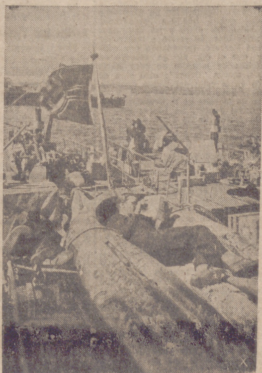
Uno de los marineros alemanes está en el bote neumático leyendo una novela que comenzó antes de la orden de partir.