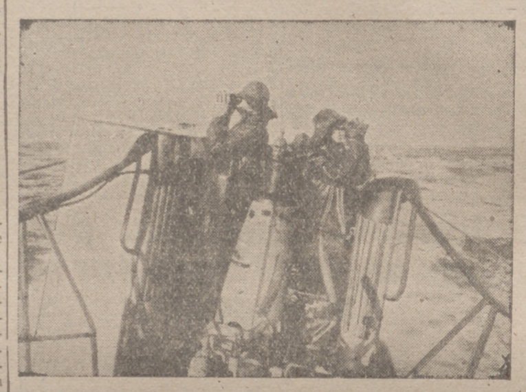
Submarino alemán en el Atlántico, donde tantas pérdidas sufre la flota aliada. Desde la torre observan los vigías el horizonte.