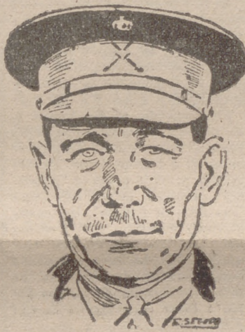
Fallecido recientemente en Madrid