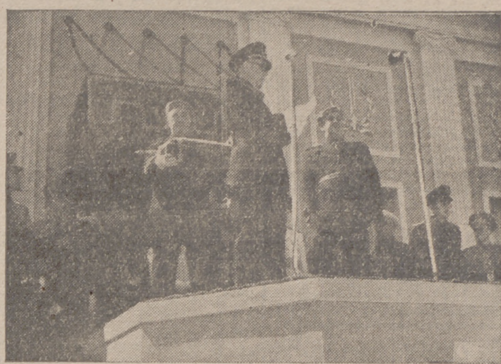
El alcalde de Huelva hace la ofrenda al Caudillo de la espada de la Victoria, que le entregó en nombre de todos los Ayuntamientos españoles.