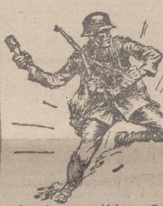
146 aviones soviéticos. Otros nueve aparatos enemigos fueron derribados por la acción de las armas de nuestra Infantería. Cincuenta de los setenta aviones adversarios que realizaron una incursión frustrada contra el área han sido destruidos. Esos 50 aparatos están comprendidos en la primera cifra. Las pérdidas alemanas en todo el frente oriental se elevan a cinco aviones. Las baterías de la Marina, emplazadas en la costa, han hundido en el Canal marítimo de San Petersburgo dos patrulleros soviéticos y han averiado gravemente a otros dos. En Túnez, el enemigo ha atacado con formaciones de Infantería y carros blindados, varias veces superiores numéricamente a nuestros efectivos, las posiciones germano-italianas de los sectores central y septentrional del frente. Estas operaciones fueron apoyadas por poderosas fuerzas aéreas. A pesar de la heroica resistencia de las tropas alemanas e italianas, y a pesar, también, de que fueron rechazados diferentes ataques, en el curso de los cuales fueron destruidos doce tanques y capturados algunos centenares de prisioneros, el enemigo logró abrir una profunda brecha en un punto. La batalla continúa con encarnizamiento. A lo largo de la costa francesa occidental, un barco alemán aislado, dedicado a la protección del puerto, derribó dos aviones ingleses que formaban parte de una formación de bombarderos lanzada al ataque.—Efe. (Pasa a la última página.)

En el curso de numerosos y enconados combates aéreos fueron derribados ayer, así como por la acción de la DCA,