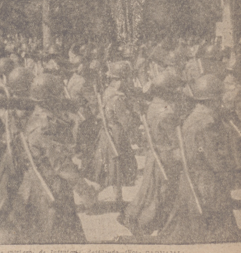
Desfile de soldados de Infantería, desfilando.